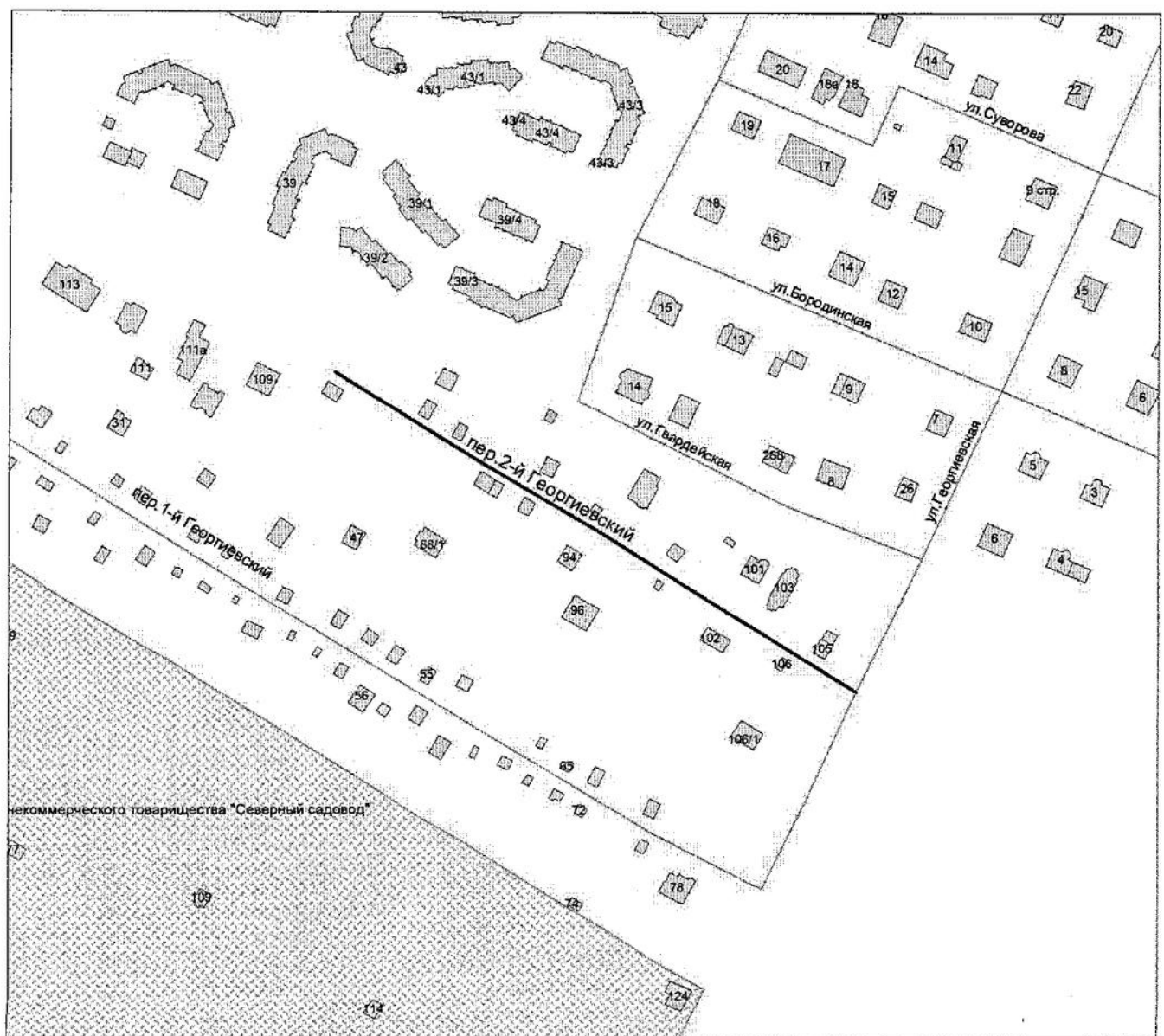
СХЕМА расположения переулка 2-го Георгиевского в Заельцовском районе города Новосибирска

Примечания: ————— — существующий элемент планировочной структуры, улично-дорожной сети; ————— — именуемый элемент улично-дорожной сети.