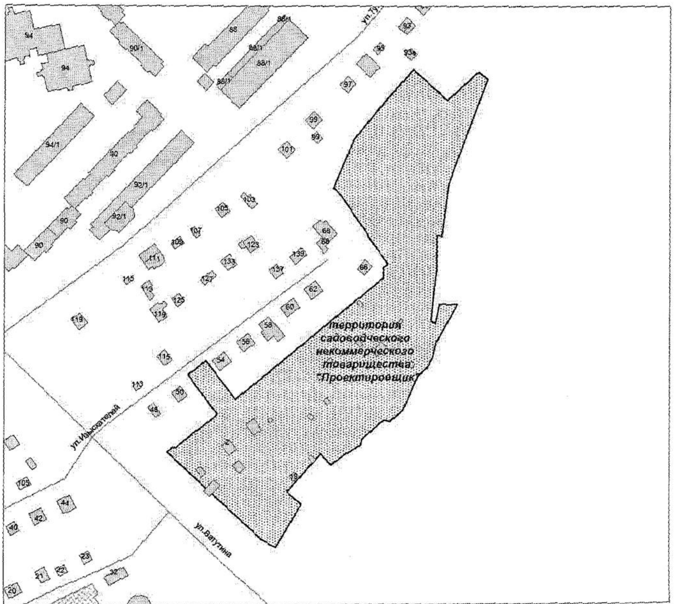
СХЕМА расположения территории садоводческого некоммерческого товарищества «Проектировщик» в Кировском районе города Новосибирска

Примечания: ———— — существующий элемент планировочной структуры, улично-дорожной сети; ————— — именуемый элемент улично-дорожной сети.