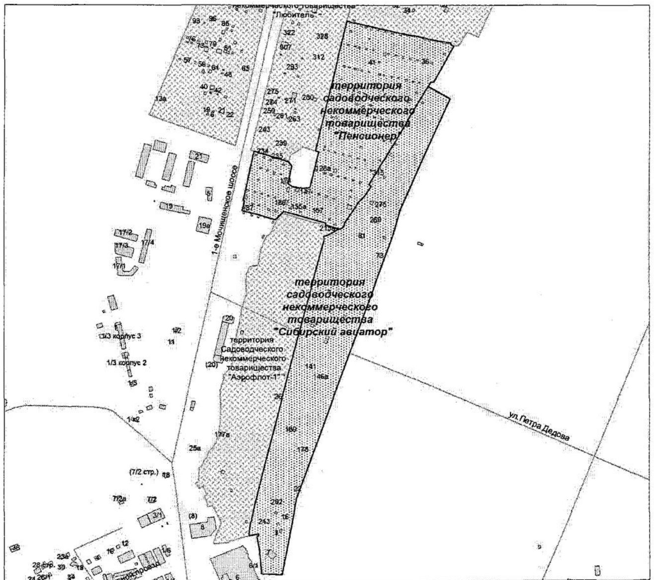
СХЕМА расположения территорий садоводческих некоммерческих товариществ «Пенсионер», «Сибирский авиатор» в Заельцовском районе города Новосибирска

Примечания: ———— — существующий элемент планировочной структуры, улично-дорожной сети; ————— — именуемый элемент улично-дорожной сети.