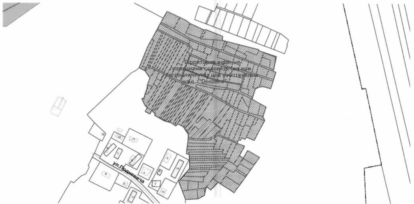
СХЕМА расположения территории ведения гражданами садоводства или огородничества для собственных нужд «Озерное» в Калининском районе города Новосибирска

Приложение 1 к постановлению мэрии города Новосибирска от 01.04.2020 № 1112